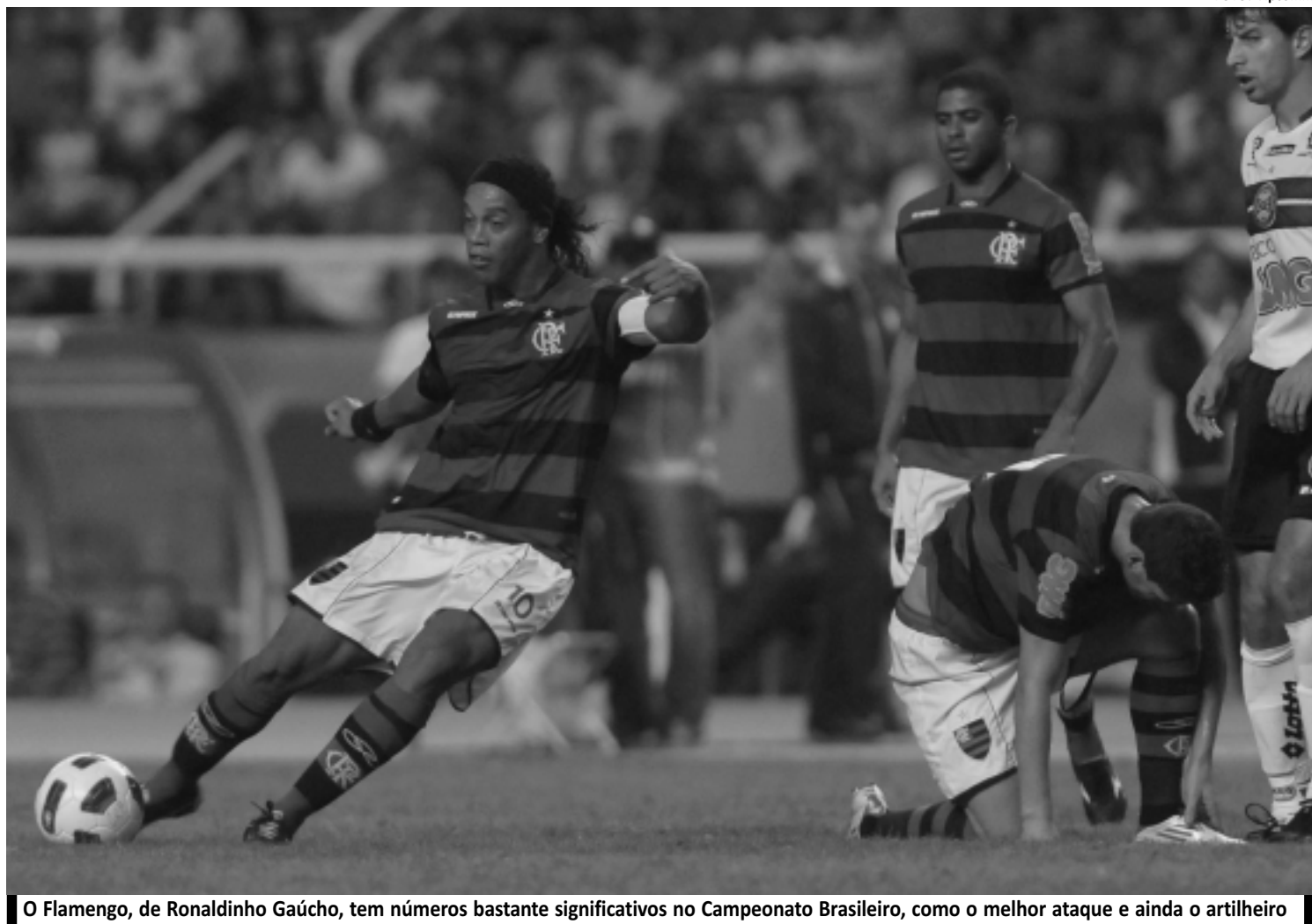
O Flamengo, de Ronaldinho Gaúcho, tem números bastante significativos no Campeonato Brasileiro, como o melhor ataque e ainda o artilheiro

"A defesa não preocupa. O pessoal pega pesado, achando que vai escalar o time. Respeitamos, mas não vou tirar assim. Resposta é o jogador confiar no trabalho do técnico. Nesse jogo, não vi nenhum erro do Welinton. Ele terá de matar um leão por dia e correr de três", afirmou o treinador.