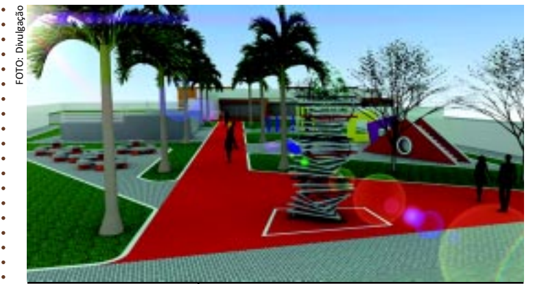
[FOTO&LEGENDA] A Prefeitura de João Pessoa lançou ontem o novo projeto do Cento de Juventude de Mangabeira, como parte dos eventos da Semana da Juventude. Os investimentos são de R$ 1,35 milhão e o empreendimento deve ficar pronto até 2012.