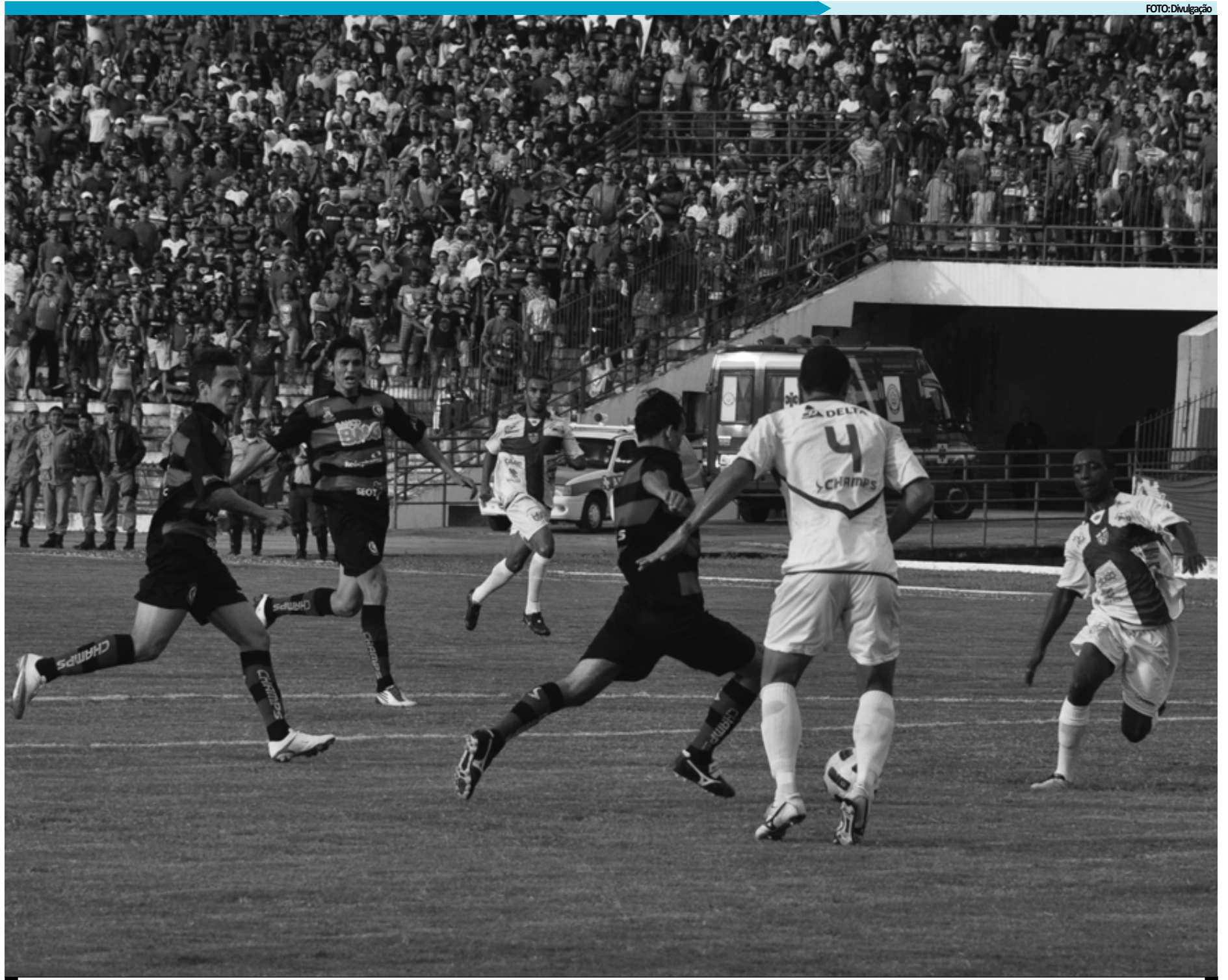
Com duas derrotas e apenas uma vitória, o Campinense precisa reagir na competição. De técnico novo, vai enfrentar o Fortaleza no próximo domingo, jogo que acontecerá no Amigão