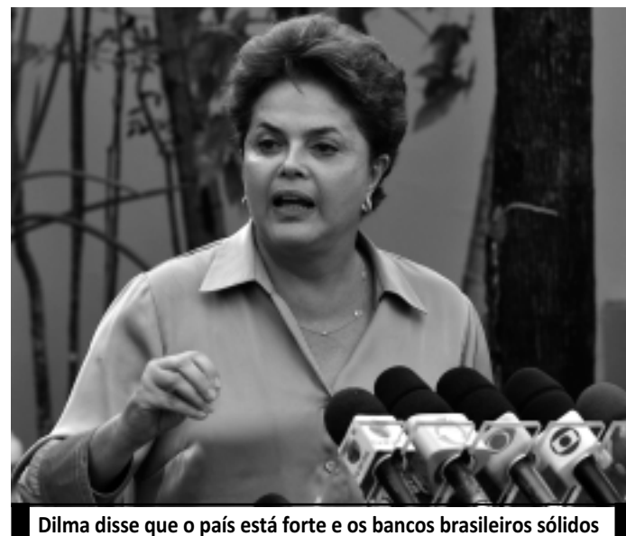
Dilma disse que o país está forte e os bancos brasileiros sólidos

Na avaliação de Dilma, para manter a posição favorável do país é preciso uma ação conjunta entre governo, empresários e sociedade. "Uma ação de seriedade, firmeza e percepção de que não podemos, neste momento, brincar e sair por aí gastando o que não temos. Temos que con-