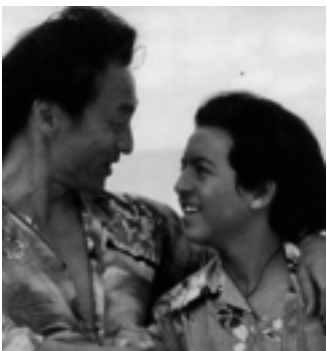
Globo exibe Johnny Tsunami hoje a tarde