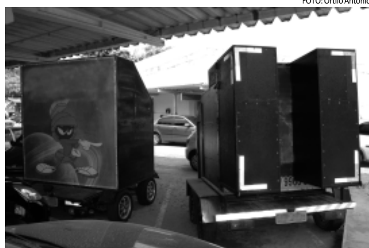
Divisão de Fiscalização da Semam, recebe, em média, 30 denúncias/dia

O repasse da denúncia é feito de imediato via rádio ou entregue em mãos aos fiscais