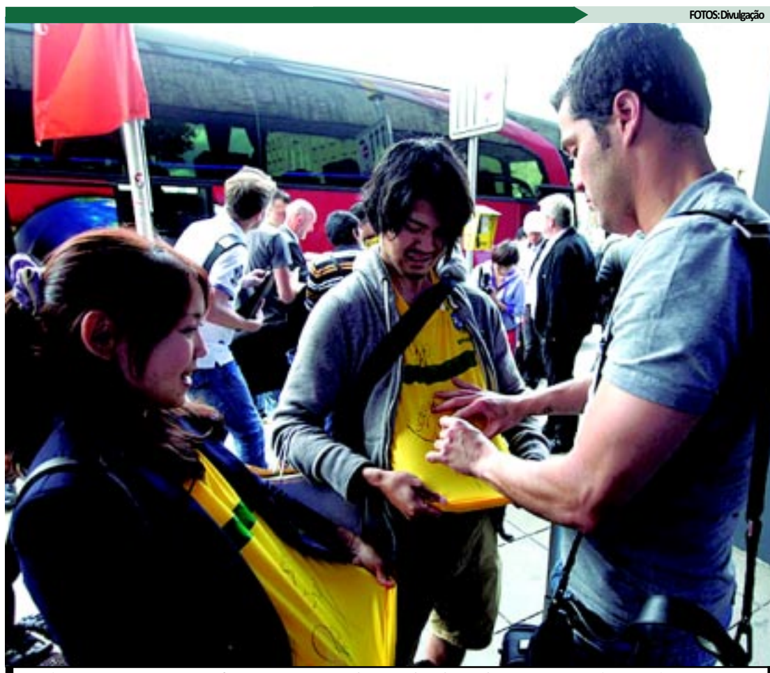
Jogadores que atuam na Europa foram os primeiros a chegar no hotel e receberam a atenção dos torcedores

O atacante Pato, outro que se encontrou com a delegação no hotel, acredita que a Seleção Brasileira vai mostrar