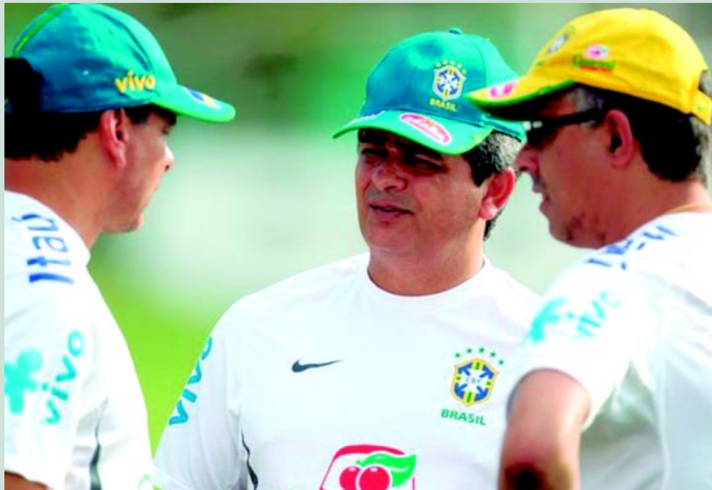
Apesar da boa campanha na primeira fase do Mundial, o técnico Ney Franco e os jogadores estão preocupados com as falhas defensivas