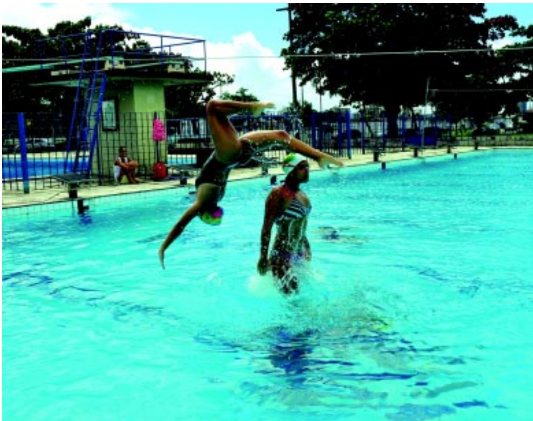
As meninas do nado sincronizado da Paraíba estão entre as melhores do Nordeste, segundo a CBDA