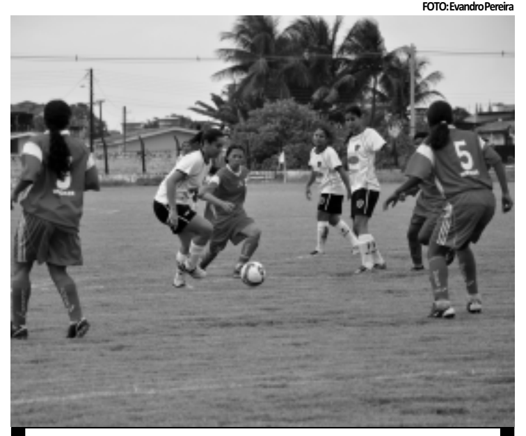
Jogadoras vão participar de um torneio seletivo nos dias 13 e 14