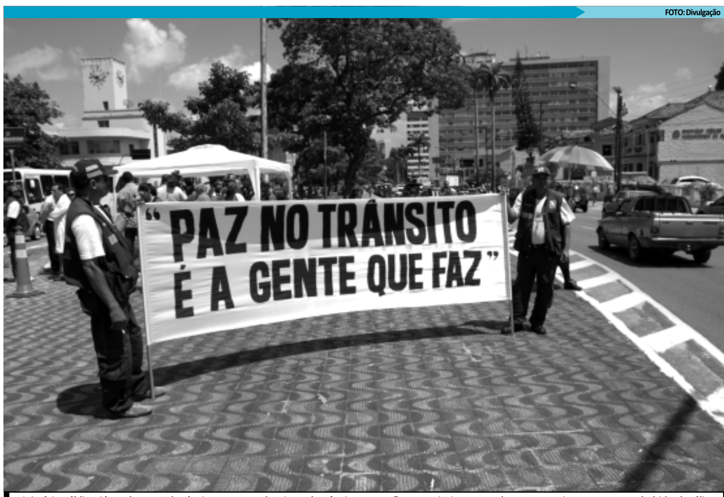
Ministério Público já recebeu 742 denúncias por causa de crimes de trânsito na Paraíba, maioria provocados por motoristas que usaram bebida alcoólica