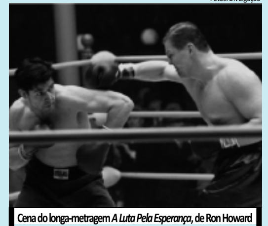
Cena da longa-metragem A Luta Pela Esperança, de Ron Howard

>>> A LUTA PELA ESPERANÇA - Jim Braddock era considerado um prodígio do boxe, mas se aposentou prematuramente devido a uma série de derrotas no ringue. Com os Estados Unidos em meio à Grande Depressão, Jim aceita viver de bicos para poder sustentar sua família. Um dia ele é escalado para enfrentar o segundo pugilista na disputa do título mundial. Para surpresa de todos Jim vence três lutas consecutivas, mesmo sendo bem mais magro que seus oponentes. SE LIGUE: Hoje, às 22h, no TNT