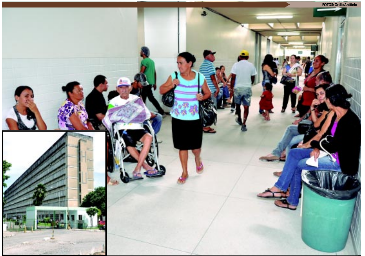
Por dia, cerca de mil pacientes passam pelos corredores do Hospital Universitário Lauro Wanderley. Só no ambulatório são 400 atendimentos por dia

O HU presta serviços públicos únicos na Paraíba de média e alta complexidade e de cirurgias bariátricas e cardíacas. A instituição conta com equipamentos modernos a exemplo de videogastrosκόpio, videoduodenoscópio e videocolonoscópio. Atualmente oferece oftalmologia com alta complexidade, maternidade de alto risco, serviço de atendimento especializado do tratamento da transmissão vertical da Aids.