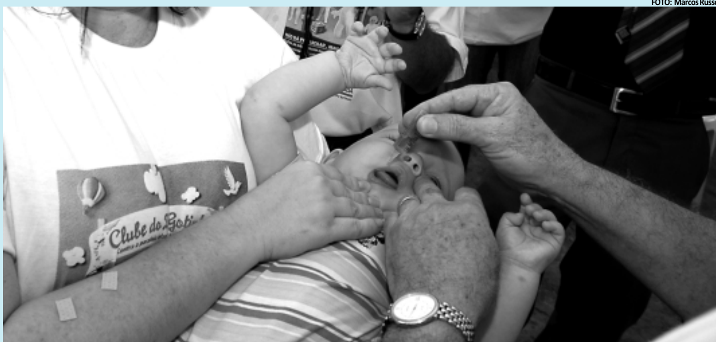
Crianças de até 5 anos devem ser imunizadas em todo o Estado. Secretaria de Saúde também vai vacinar menores de 7 anos contra o Sarampo