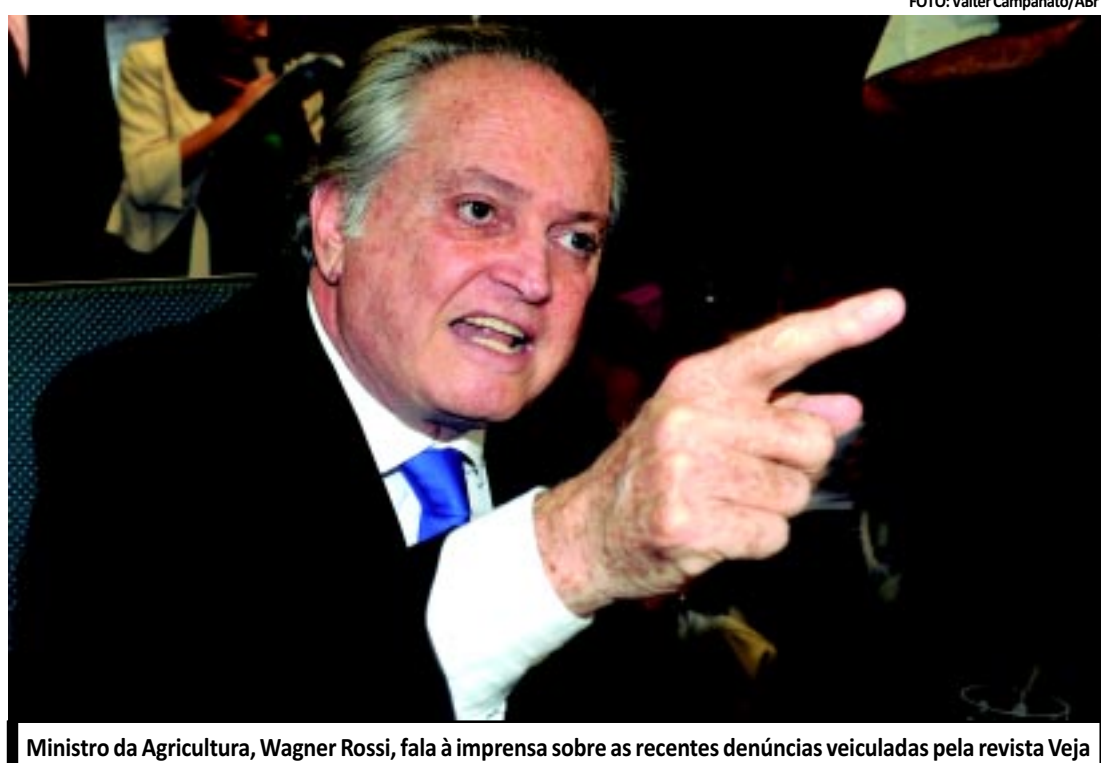
Ministro da Agricultura, Wagner Rossi, fala à imprensa sobre as recentes denúncias veiculadas pela revista Veja

Freire afirmou ter virado "rotina" haver denúncias contra o governo Dilma Rousseff. Ele ironizou o rótulo de "faxina" usado para as demissões no Ministério dos Transportes e disse que isso não foi aplicado ainda em outras áreas. "Não acredito em quem vem com vassoura, porque teria que passar a vassoura em cima do Lula, e isso eu não acredito que ela vai fazer".