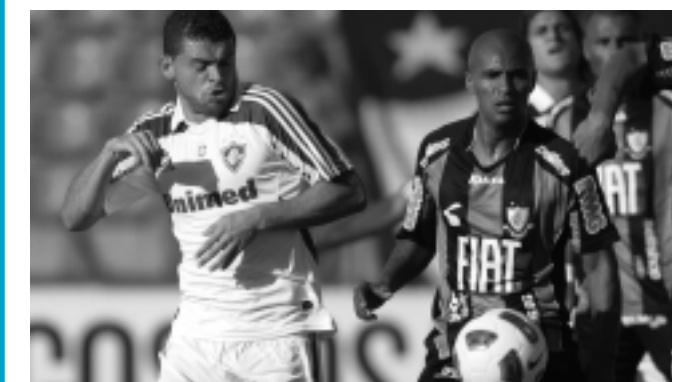
O América-MG, mesmo vencendo o Flu, segue na lanterna